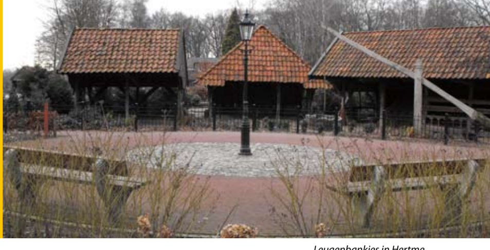
Leugenbankjes in Hertme